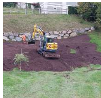
Humusierung des Pffarrriegels