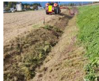
Mäharbeiten in Freidorf