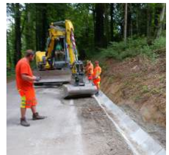
Halbschalenverlegung - Erosion vorbeugen