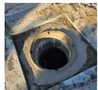
Kanalschachtsanierung im Ortsgebiet