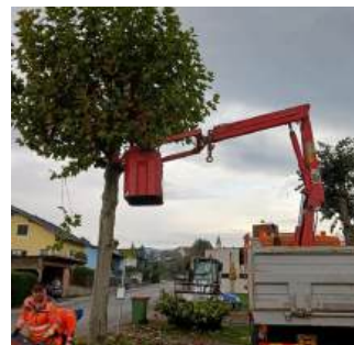
Alljährliche Baumverjüngung in St. Peter