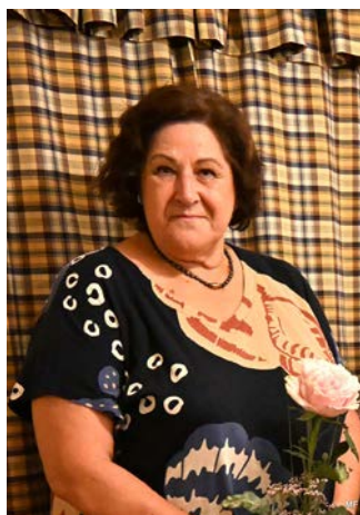
Marianne Koch 70. Geburtstag St. Peter