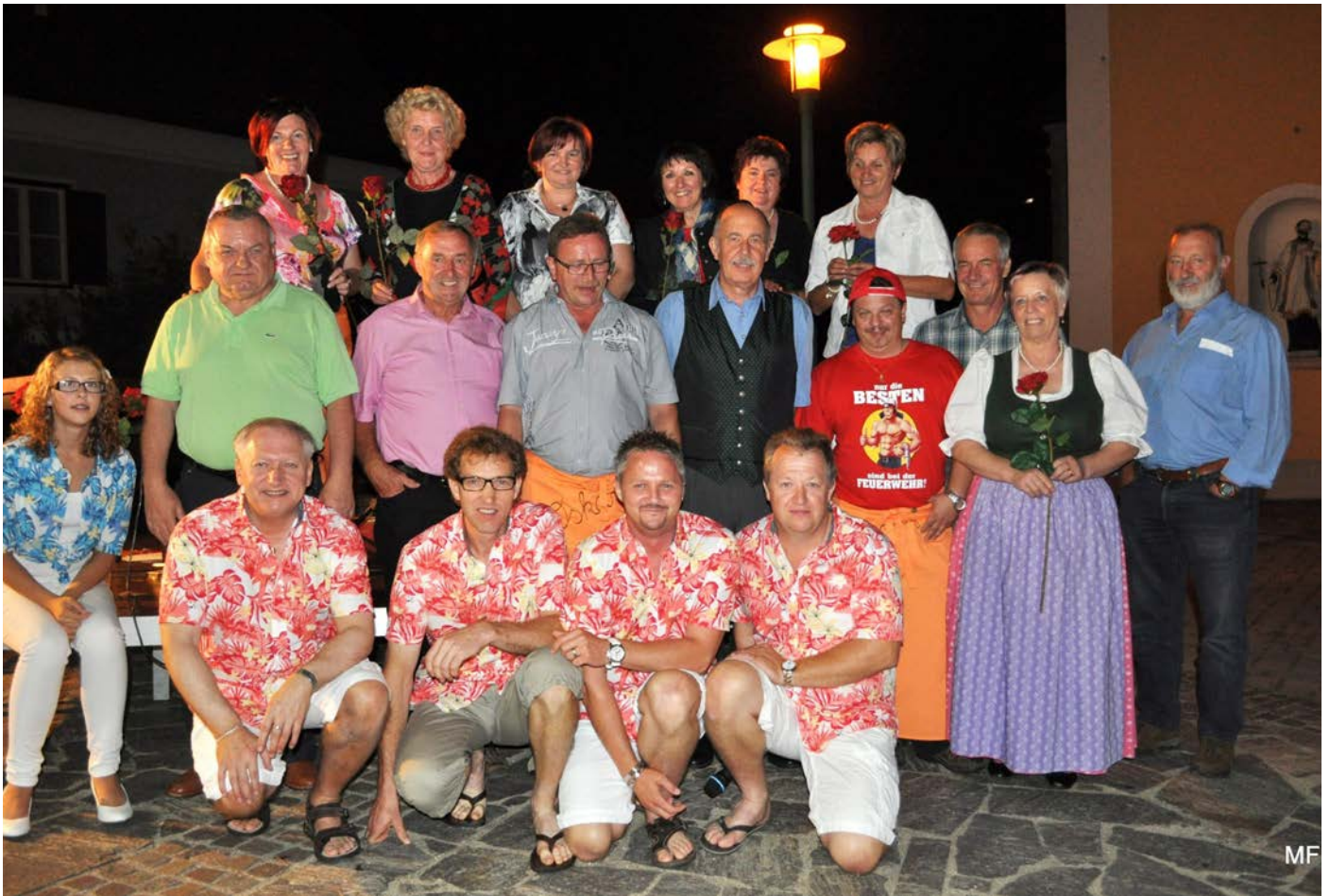
Benefizveranstaltung für die neue Orgel-Sommernachtstraum im August 2012