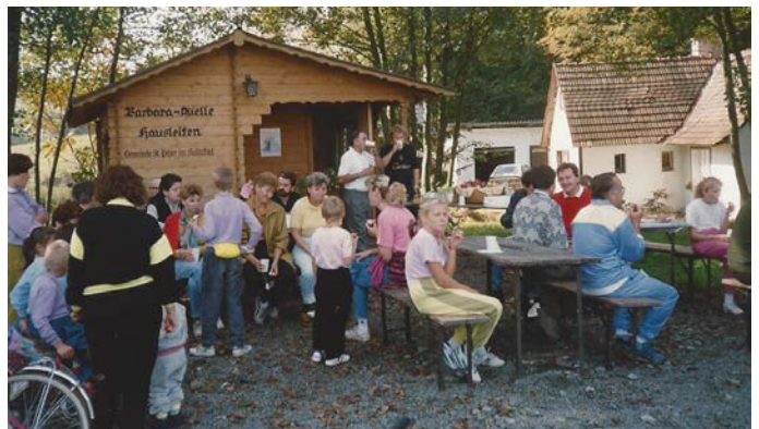
Radwandertag vom ÖAAB St. Peter, 30. September 1990