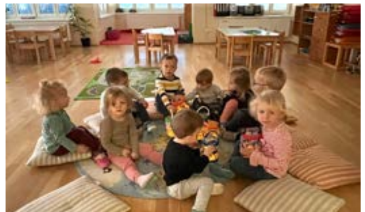
Rote Gruppe (unter 3 J.) mit ihren Laternen