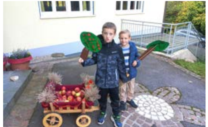
Der Erntedankwagen wird stolz präsentiert.